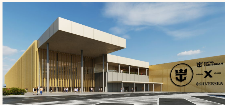
Renderitzat de l'edifici de La Terminal G.

Per garantir l'anonimat durant la fase d'avaluació del comitè d'experts en art, sol·licitem que no s'inclouin dades personals del participant al dossier.