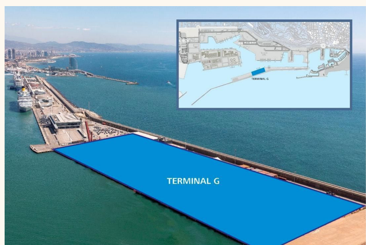
Espai del Moll Adossat on subirà la Terminal G

Durant la temporada baixa, els visitants tindran una experiència diferent. Mitjançant visites guiades o participant en conferències i esdeveniments podran gaudir.