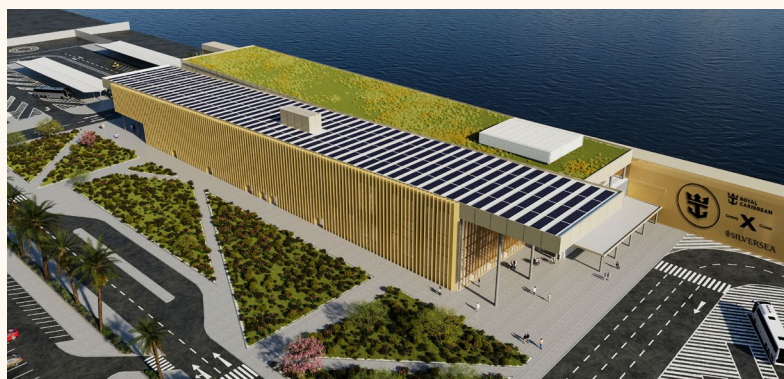
Renderitzat de l'entrada de l'edifici de la Terminal G

La productora donarà suport a l'artista i a la Direcció artística en l'organització i logística de les trobades previstes dins del procés comunitari, així com en la gestió de permisos i contractes, si fossin necessaris.